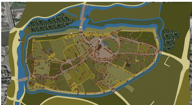
Die Stadt in ihren Grenzen

Duisburg präsentiert sich hier als eine Stadt an der Wende vom späten Mittelalter zur frühen Neuzeit. Charakteristisch ist das Nebeneinander von unterschiedlich alten Baustrukturen. Manche Häuser und Anwesen zeigen sich noch weitgehend unverändert im Gewand des hohen bis späten Mittelalters, während andere den neuen Geist der Renaissance bereits deutlich durch ihre Bauformen zum Ausdruck bringen. Das Zentrum und die Keimzelle der Stadt, die befestigte Pfalz, ist noch deutlich am Baubestand abzulesen. Die Wehranlagen waren in dieser Zeit aber bereits lange niedergelegt und viele Grundstücke der ehemaligen Pfalz sind mit bürgerlichen Anwesen überbaut. Im Zuge der Einführung von Feuerwaffen im 15. Jh. hatte auch die Stadtmauer ihre militärische Bedeutung verloren und wurden nicht mehr aufwändig unterhalten.