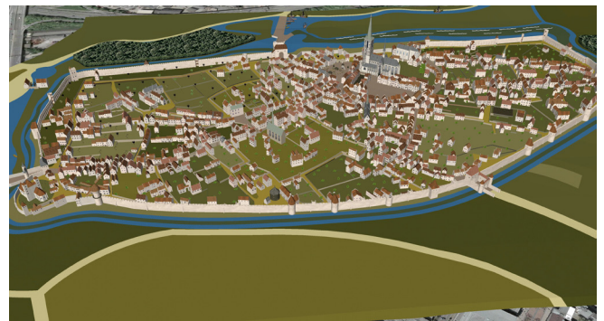
Die Stadt in der Vogelperspektive