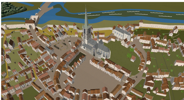
Burgplatz mit Salvatorkirche