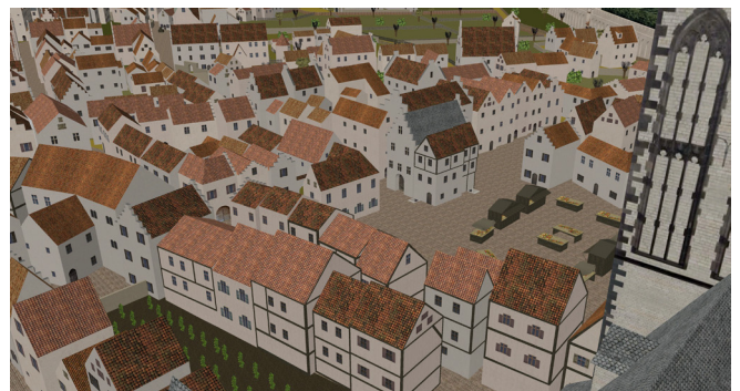
Corputius Blick von der Salvatorkirche